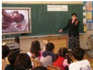
児童持参のビデオを視聴し調べる意欲を持たせる