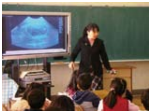
出産の様子を映像視聴し、興味・関心を高める