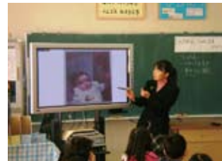
小さい頃の写真を使って人物当て