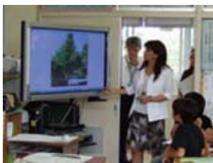
静止画を提示して、植物の変化を確認する