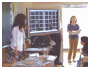
動画を活用して温度と成長の関係を考える