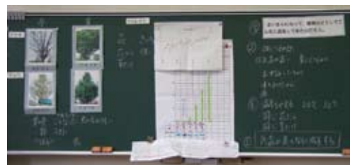
春の頃の写真を提示し、初夏になって、植物が著しく成長してきた理由を話し合う