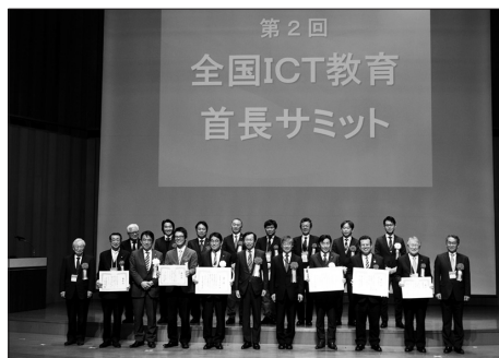
写真 昨年の表彰の様子

<問い合わせ先> 全国ICT教育首長協議会 事務局 TEL 03-3431-2186